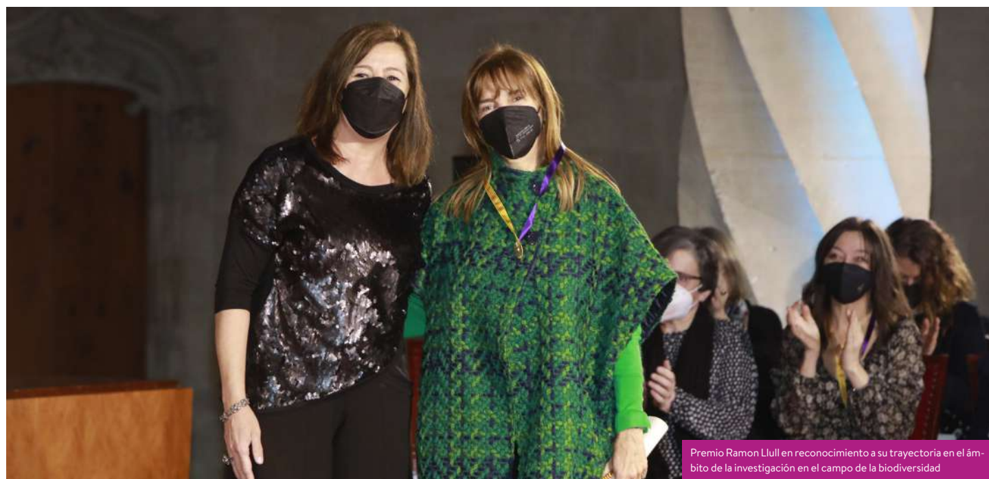
Premio Ramon Llull en reconocimiento a su trayectoria en el ámbito de la investigación en el campo de la biodiversidad

“Si no se toman medidas de sostenibilidad, Baleares será insostenible”