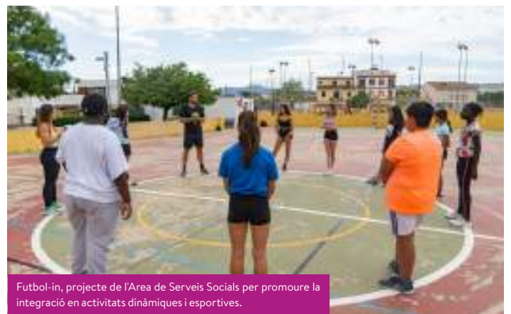
Futbol-in, projecte de l'Àrea de Serveis Socials per promoure la integració en activitats dinàmiques i esportives.