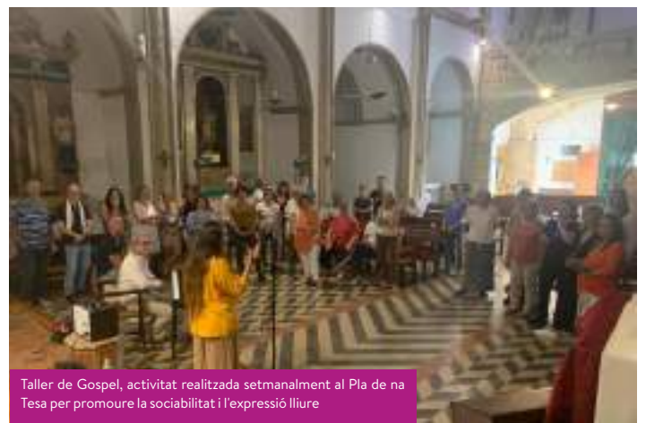
Taller de Gospel, activitat realitzada setmanalment al Pla de na Tesa per promoure la sociabilitat i l'expressió lliure